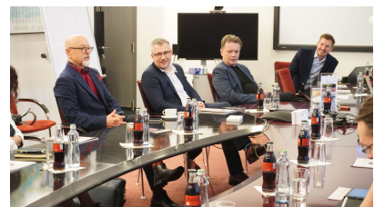
První letošní setkání členů Elite klubu MSK