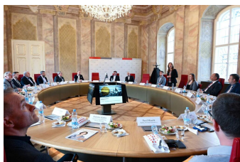
Setkání Elite klubu Morava s primátorkou města Brna