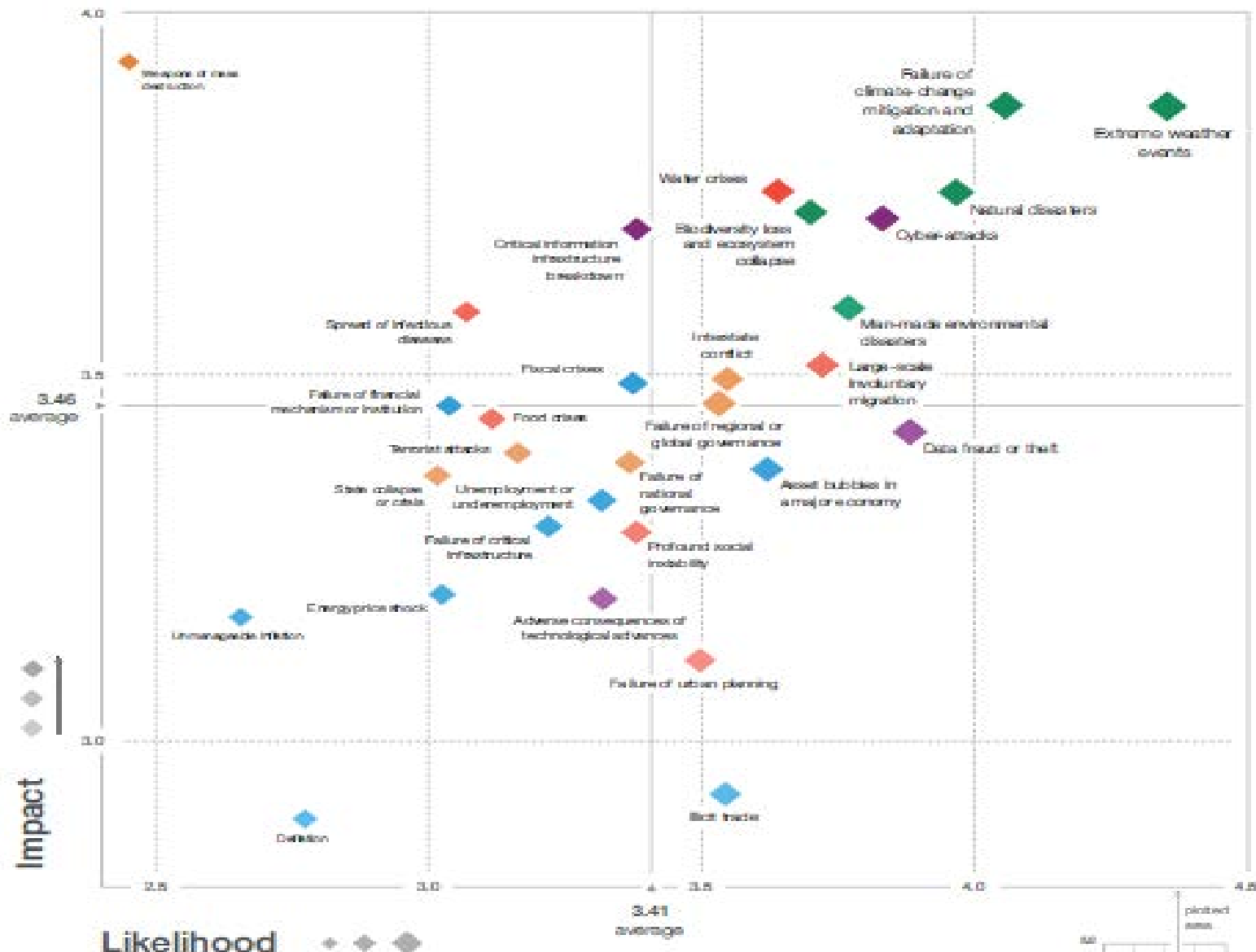
Figure 1: The Global Risks Landscape 2019